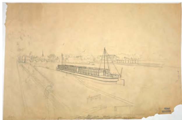
前川國男作画のバース。前川が落書きしたと思われる日本語があり、「明けぬれば、憂しところに、暮れぬれば」と読める(FLC12063)